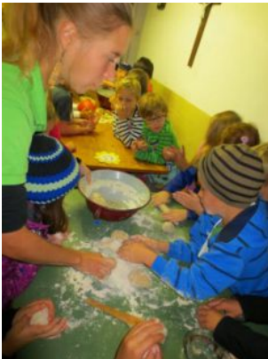
Selbst Nahrungsmittel erzeugen