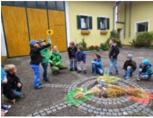
Spielerisch lernen die Kinder Themen rund um die Natur.

OTTNANG. Bauernhof macht Schule, beim Mathiasnhof in Ottnang. Gemäß dem Motto „Die Natur ist unser bester Lehrer“ durften bereits mehrere Schulklassen der umliegenden Volksschulen dem Bauernhof der Familie Waldenberger einen Besuch abstatten.