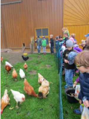
Auch die Welt der Tiere darf nicht fehlen.

Nähere Infos unter www.mathiasnhof.jimdo.com und www.schuleambauernhof.at